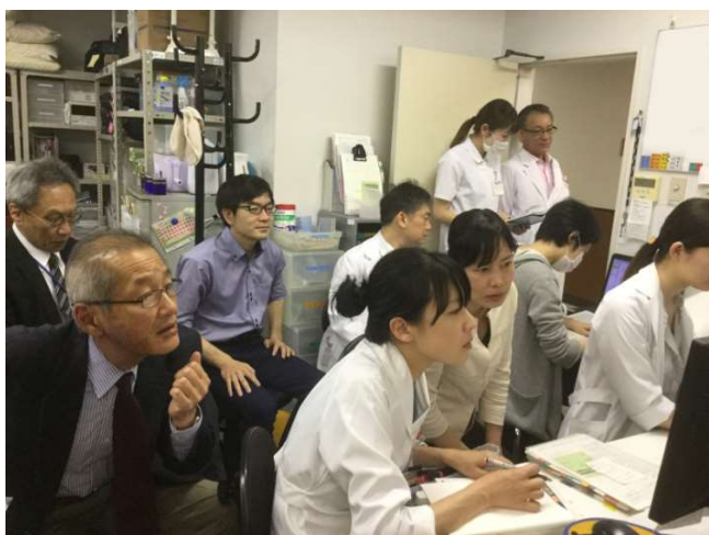
毎朝の症例カンファレンスの風景