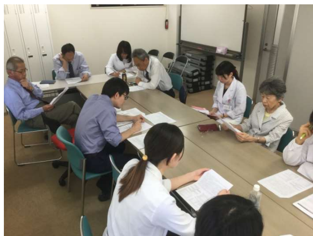
抄読会（週1回）時の風景