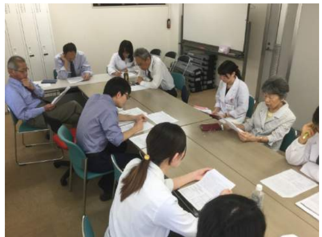
抄読会（週 1 回）時の風景